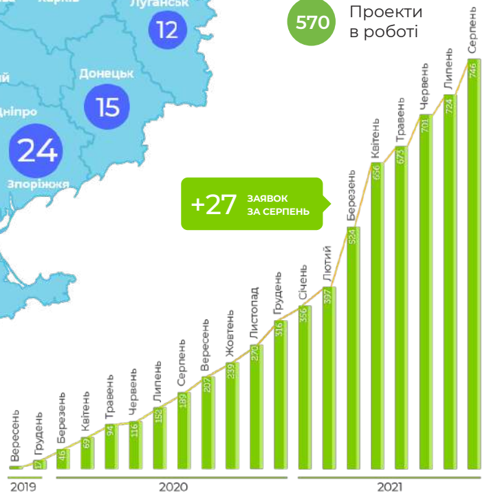
Динаміка надходжень заявок за весь період