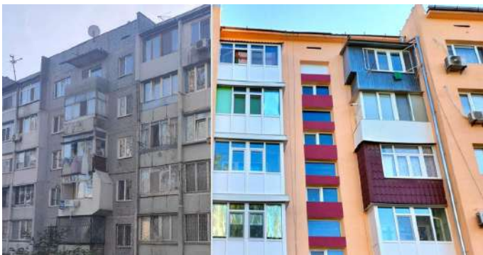
ОСББ «Паркова-5М», місто Миколаїв Пакет Б «Комплексний» Деталі за посиланням: https://bit.ly/3Z5YTkK