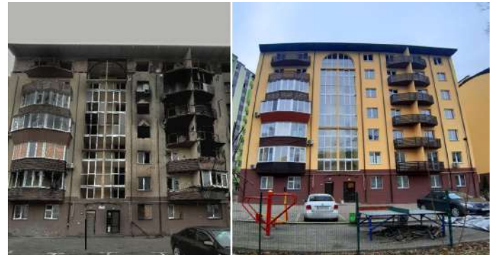
ОСББ «НОВО-ОСКОЛЬСЬКИЙ», БУДИНОК 1 місто Ірпінь, Київська область