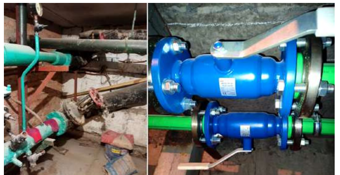
ОСББ «Київська 53», місто Житомир Пакет А «Легкий» Деталі за посиланням: https://bit.ly/3XKifKl