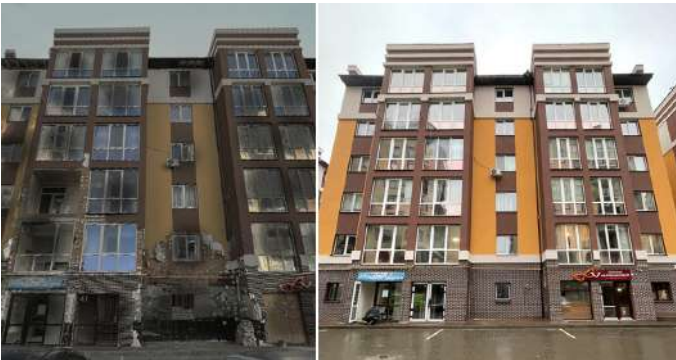
ОСББ «ЗАТИШНИЙ 2020», БУДИНОК 2 місто Ірпінь, Київська область