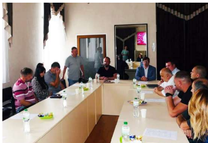
4 Калуш: https://tinyurl.com/yuttarap