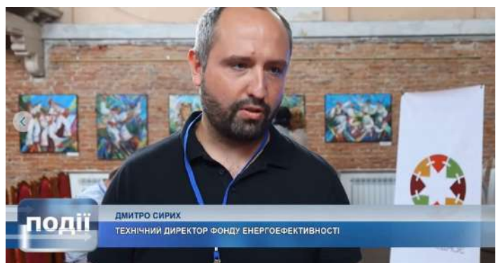
5 Коломия: https://tinyurl.com/mryk3uzb