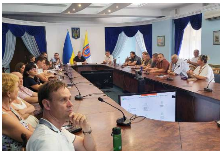
3 Одеса: https://tinyurl.com/3xumndc4