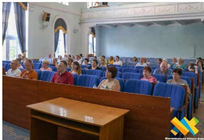
2 Житомир: https://tinyurl.com/4cedftd8