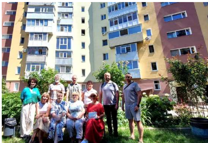
1 Полтава: https://tinyurl.com/3fnsrrz8