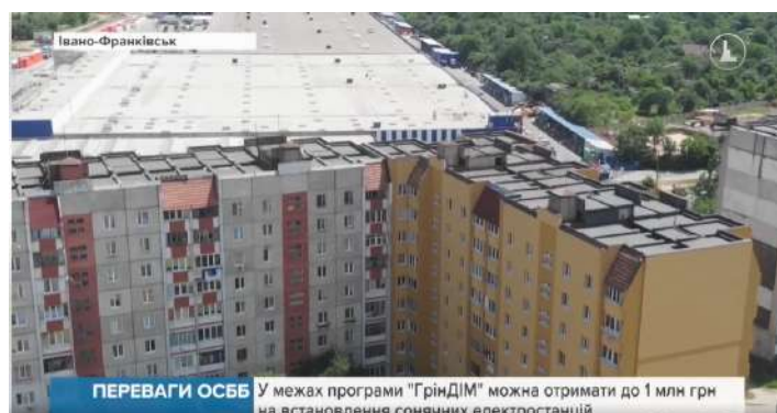
6 Івано-Франківськ: https://tinyurl.com/5n8hn2fp